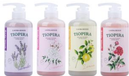
ТЮПИРА гель для душа

LAURA ROSSE , любимая всеми с 2004 года, возродилась как ТЮПИРА с ингредиентом BETA-GLUCAN в 2020 году