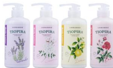
ТЮПИРА лосьон для тела

В состав средств добавлен новый ингредиент – БЕТА-ГЛЮКАН