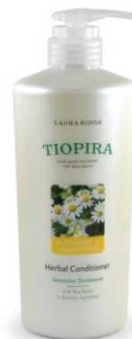
Rosemary & Chamomile (Conditioner)

В состав средств добавлен новый ингредиент – БЕТА-ГЛЮКАН