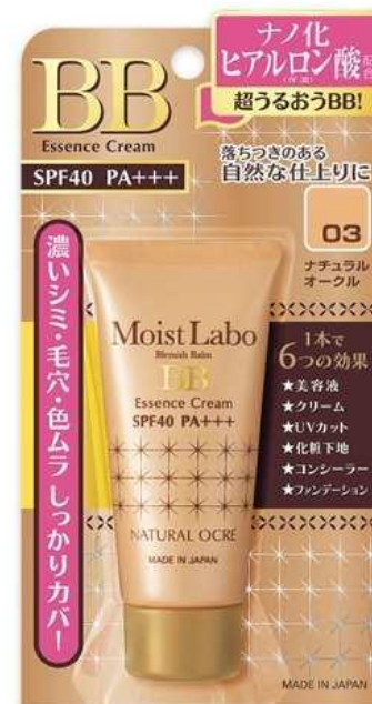
тон «натуральная охра»