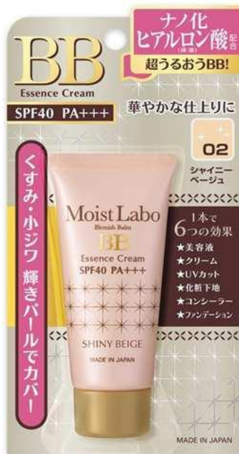
тон «сияющий бежевый»