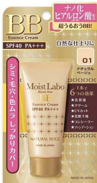
тон «натуральный бежевый»