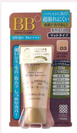
тон 3 «натуральная охра»