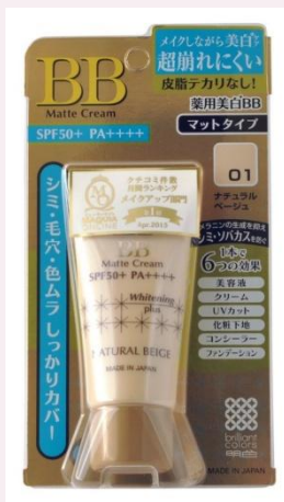
тон 1 «натуральный бежевый»